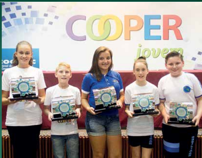
O programa incentiva talentos literários jovens

Para Renato Nobile, ações como essa destacam a importância do Cooperjovem. “O programa leva às escolas, às crianças e adolescentes, os valores que são característicos do nosso movimento, a ideia de que podemos e devemos construir juntos, de que ajudar o outro a ser melhor, a crescer, significa crescer também”, conclui o superintendente do Sistema OCB.