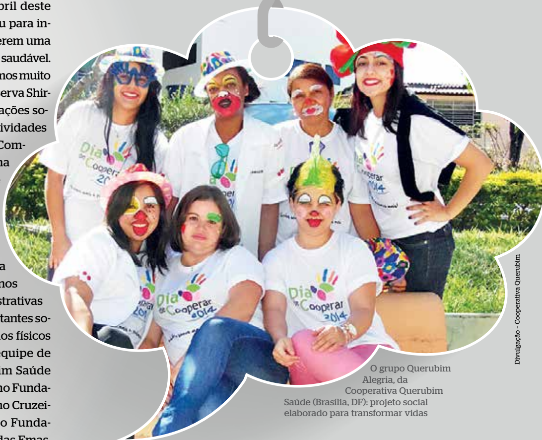
O grupo Querubim Alegria, da Cooperativa Querubim Saúde (Brasília, DF): projeto social elaborado para transformar vidas